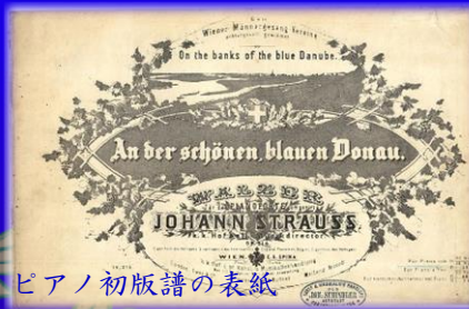
ピアノ初版譜の表紙