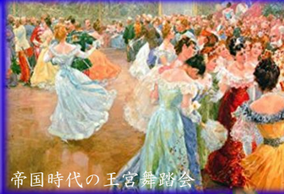
帝国時代の王宮舞踏会