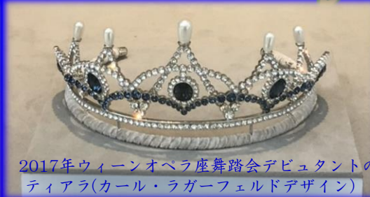
2017年ウィーンオペラ座舞踏会デビュータントのティアラ(カール・ラガーフェルドデザイン)